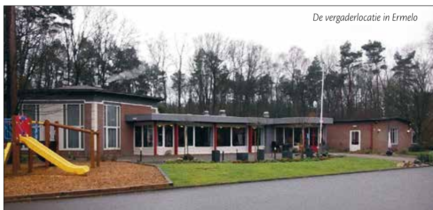
De vergaderlocatie in Ermelo

Neem afslag 12 richting Ermelo richting N303, rij 400m Sla rechtsaf naar de Oranjelaan/N303, Ga verder op de N303, ga rechtdoor over 4 rotondes, rij 3,4 km Neem op de rotonde de 3e afslag naar Leuvenumseweg, rij 1,3 km Sla rechtsaf richting Leuvenumseweg, u vindt de locatie rechts.