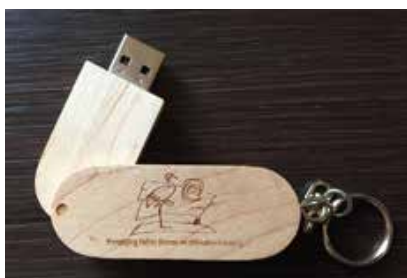
Nieuwe leden ontvangen nu een usb-stick waarop de jaargangen 2014-2015 digitaal geplaatst zijn.