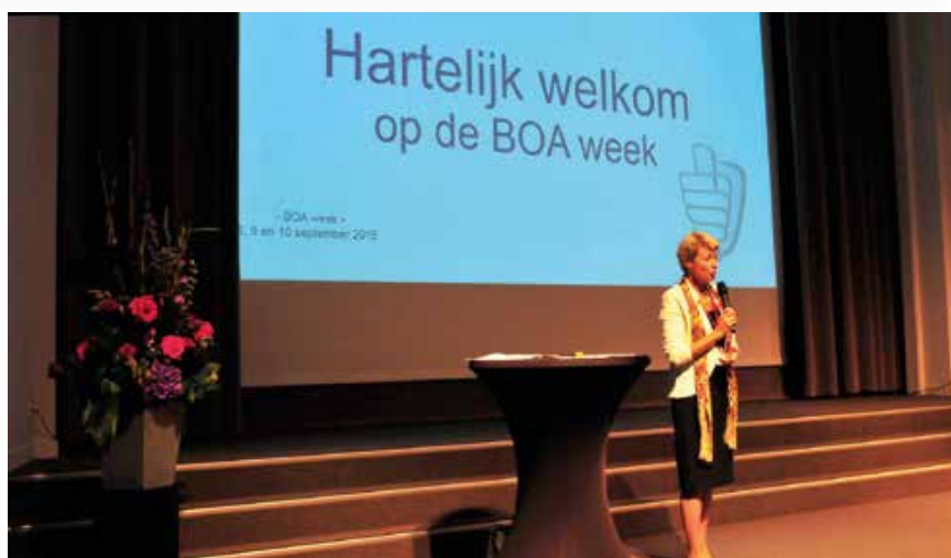
Opening van de boa-week.