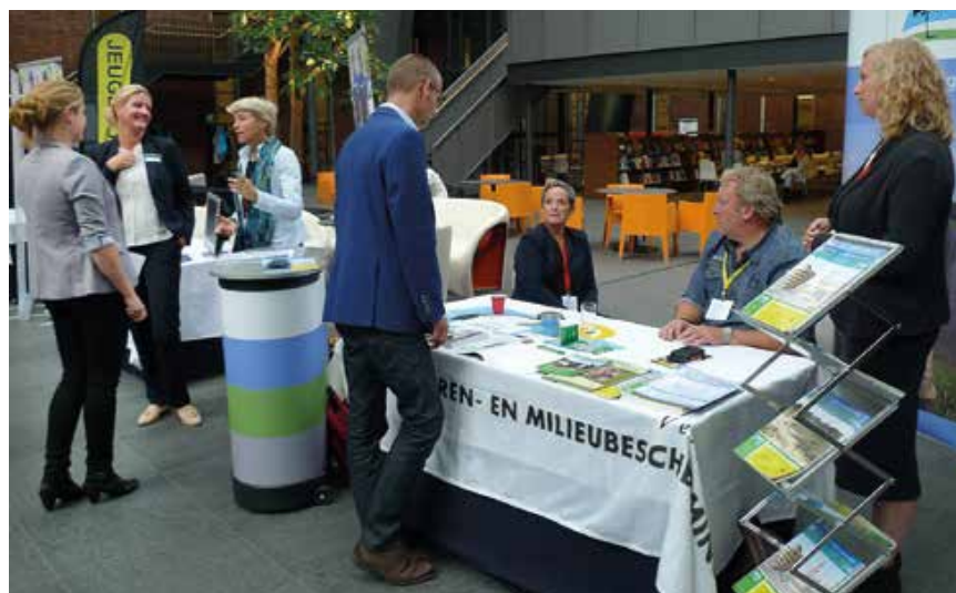
Drukte bij onze nieuwe stand.

Er is dit jaar geïnvesteerd in het innen van achterstallige contributie. Dit heeft veel tijd gekost, maar we hopen hiermee een deel van de achterstand terug te halen. Tevens zal tijdens de ALV van 2016 worden voorgesteld om het lidmaatschap van leden, die al geruime tijd geen contributie meer betaald hebben, te beëindigen.