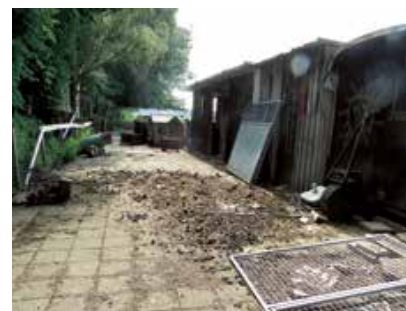
Achter een hek liggen grote hoeveelheden paardenstront.