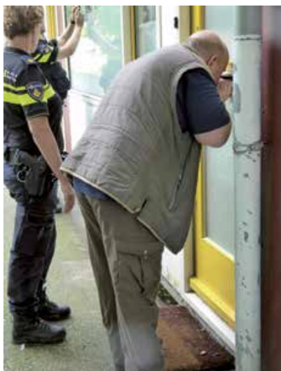
We zien door de brievenbus een paar kleine poezen op de trap zitten.