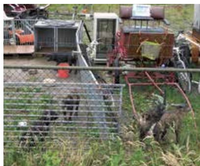
Je vraagt je soms af waarom eigenaren de honden op deze manier huisvesten.

informatie over een actie voor komend weekend. Hij heeft piketdienst en wordt dus even bijgepraat.