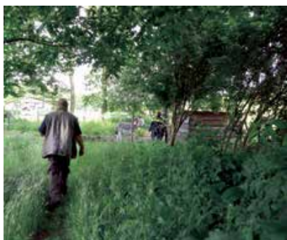
Het beest staat in een weilje met louter zuring en het is duidelijk blij met ons gezelschap.