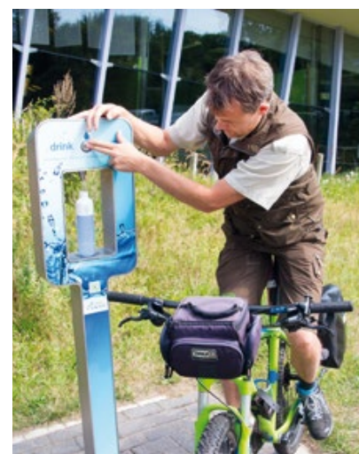
Voor de fietspatrouille even langs het watertappunt.

gebied. Dit maakt het noodzakelijk dat we haar beschermen, bijvoorbeeld door het toegangsverbod voor gemotoriseerd verkeer waarover we het zojuist hadden. Een andere regel is dat in het grootste deel van het Noordhollands Duinreservaat honden kort aangelijnd dienen te zijn. De duinen zijn rustgebieden voor vogels en zoogdieren. Honden zorgen er voor verstoring en zelfs gevaar. Ook bezoekers kunnen last van hebben van loslopende honden. Sommige mensen zijn er bang voor. In het gehele duinreservaat is een zogenaamde fietsregeling van kracht. Dit houdt in dat je alleen mag fietsen op de aangewezen verharde fietspaden en op onverharde fietspaden tot 10.30 uur. Diverse onverharde paden zijn voorzien van een inrijverbod voor fietsen. Prioriteit voor ons heeft het toezicht op illegaal gemotoriseerd verkeer, het niet hebben van een geldige duintoegangkaart en loslopende honden. Bij het vaststellen van dit soort overtredingen volgt in principe een proces-verbaal".