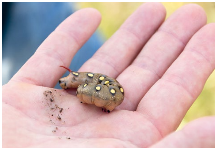
Evert-Jan laat het beestje vanuit een veilige positie in zijn hand van alle kanten bekijken.

Verder valt het me op dat er diverse mensen in de begroeiing buiten de paden bessen of iets dergelijks aan het plukken zijn. Evert-Jan legt me uit dat deze mensen zogenaamde dauwbramen – in de volksmond ook wel duinbramen genoemd – aan het plukken zijn. In de gehele maand augustus mag het publiek zich buiten de paden begeven om deze, overigens heerlijke, bramen te plukken. In vergelijking met de mij bekende bosbraam is de dauwbraam iets kleiner, sappiger en iets minder zoet, waardoor de smaak wat frisser is.