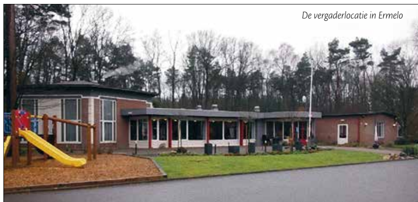
De vergaderlocatie in Ermelo