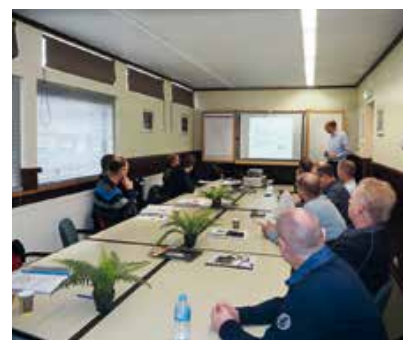
Meer dan zeventig deelnemers – bod's en politieambtenaren – zijn geschoold en hebben hun ervaringen kunnen delen.