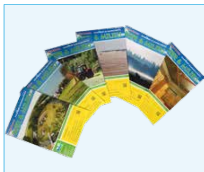
In 2016 zijn we er weer in geslaagd om zes nummers uit te brengen.

In 2016 zijn we er weer in geslaagd om zes nummers uit te brengen. Ons streven blijft om een goede mix te hebben tussen de diverse kleursporen. We zijn daar ook in 2016 niet helemaal in geslaagd. Hoofdaandeel van de geplaatste artikelen is toch de groene wet- en regelgeving en datgene wat betrekking heeft op de bescherming van dieren. De grijze wetgeving blijft daarmee wat achter en dat geldt zeker voor de bijdragen die ingezonden worden voor de rubriek "Uit de praktijk". Op zich is het wel enigszins verklaarbaar omdat er in 2016 en de komende jaren veel wijzigt op het gebied van de "groene" wetgeving. Er is daardoor ook veel meer reden om over de groene wetgeving te schrijven.