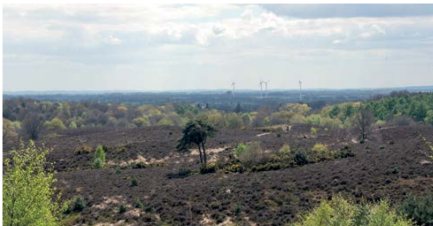
Een prachtig uitzicht richting Rijks van Nijmegen en Montferland.

begon ik voor een periode van drie jaar bij de Faunabeheereenheid Utrecht. Daar hield ik me bezig met het schrijven van het faunabeheersplan en de praktische uitvoering daarvan. Omdat het werk bij de Faunabeheereenheid stopte heb ik eind 2016 gesolliciteerd bij de Omgevingsdienst Veluwe IJssel (OVIJ) en daar werd ik ook aangenomen. Mijn werkzaamheden voor het milieu zijn nu veel breder geworden dan alleen maar groen, want ik doe nu ook integrale bedrijfscontroles. Verder heb ik hier, behalve de groene wetgeving, ook de onderwerpen bodem en asbest in mijn pakket.