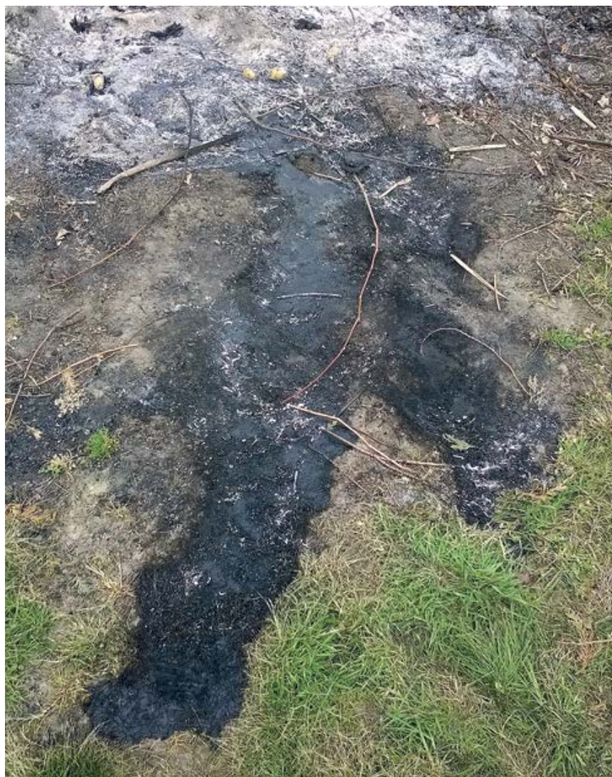
Gevolgen van het illegaal verbranden van afval.

Ook op het gebied van milieu kom ik veel verschillende zaken tegen, voorbeelden hiervan zijn illegale asbestverwijderingen, bodemverontreinigingen, maar ook het toepassen van grond die niet aan de vereiste kwaliteit voldoet. Hierbij kan worden gedacht aan grond met meer dan de toegestane hoeveelheid bodemvreemd materiaal, zoals puin in deze situatie (Ard toont mij een foto). Op deze foto zie je een locatie waar een collega en ik dit hebben geconstateerd".