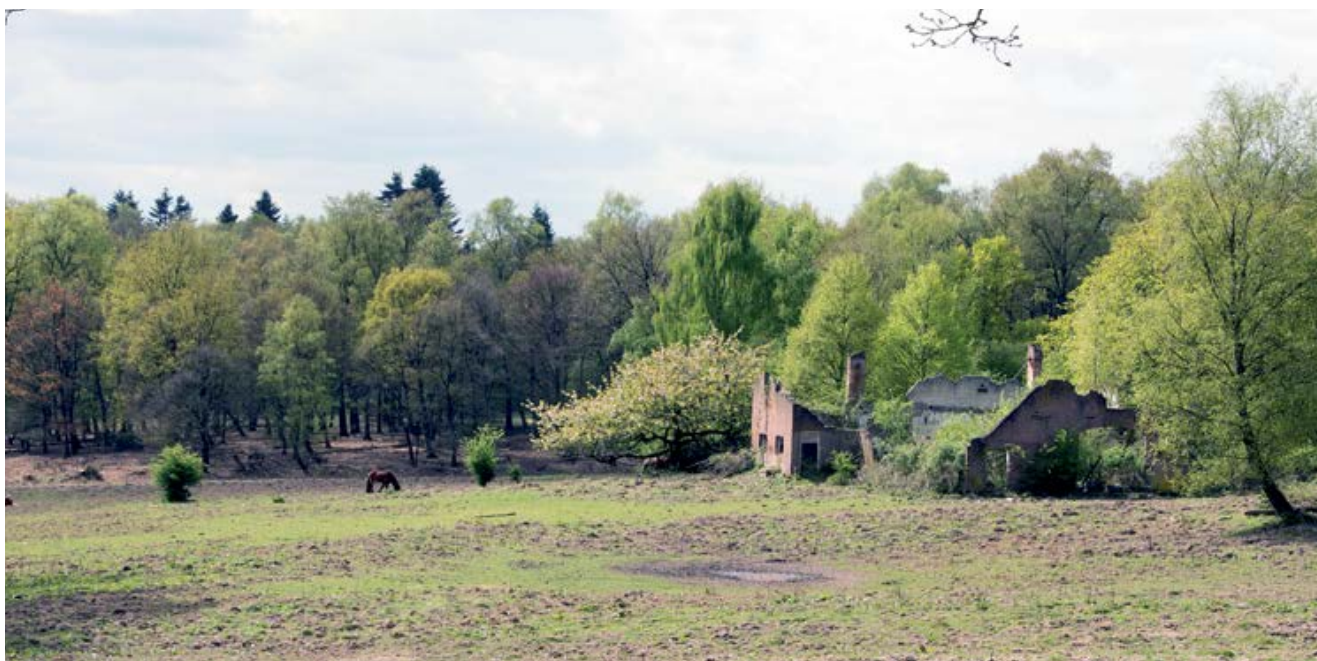
Dieren spotten bij een ruïne van een oude boerderij.

Wij stoppen bij een van de vele uitzichtpunten die het gebied rijk is, genaamd 'Zijpenberg'. Van daaruit kijken we, over de in dalen en heuvels gelegen heidevelden, naar de in de verte gelegen Posbank. Uiteraard doen we ook de natuur- en wildobservatiepost Herikhuizen aan. Deze observatieplaats bestaat uit een soort stalen loopbrug die uitkomt op een bordes. Dat bordes geeft uitzicht op een glooiend stuk open terrein omgeven door bos, waar een ruïne ligt van een oude boerderij. Hier lopen een viertal IJslandse paarden, één van de twee soorten grote grazers die door Natuurmonumenten in het gebied is uitgezet.