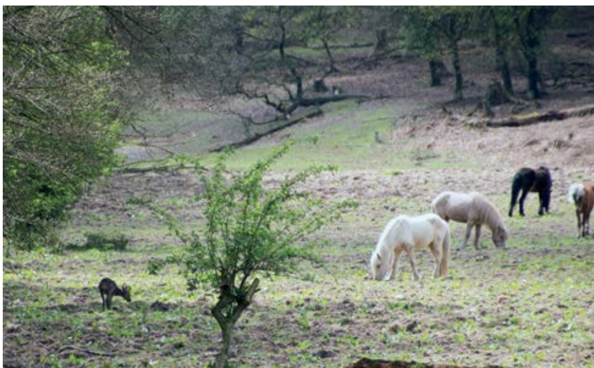
Deze reebok trekt zich niets aan van IJslanders.

Maar goed, gewoon de nodige afstand bewaren en de dieren verder met rust laten is het devies.