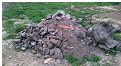
Een aangetroffen hoeveelheid puin.

"De OVIJ is een van de zeven Gelderse omgevingsdiensten en voert de milieutaken uit van de gemeenten Epe, Voorst, Brummen, Apeldoorn en de provincie Gelderland. We zijn dus de uitvoeringsorganisatie voor vergunningverlening, toezicht en handhaving op het terrein van milieu(veiligheid). Het kantoor van de OVIJ bevindt zich in het stadskantoor van de gemeente Apeldoorn, in het centrum.