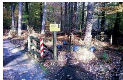
Een dump van hennepafval waarbij de inhoud verschillende sporen bevatte, het was toen mogelijk verschillende DNA-monsters te nemen.

De meest voorkomende overtredingen liggen op het gebied van de toegangsregels, zoals loslopende honden waar dat niet is toegestaan, mountainbikers en ruiters buiten de aangewezen routes, motorcrossers, maar ook afvaldumpingen. Zo hadden we een dump van hennepafval waarbij de inhoud verschillende sporen bevatte, het was toen mogelijk verschillende DNA-monsters te nemen. Later bleek echter, na overleg met en zienswijze van de officier van justitie, dat er helaas onvoldoende opsporingsindicatie bestond om verder onderzoek in te stellen.