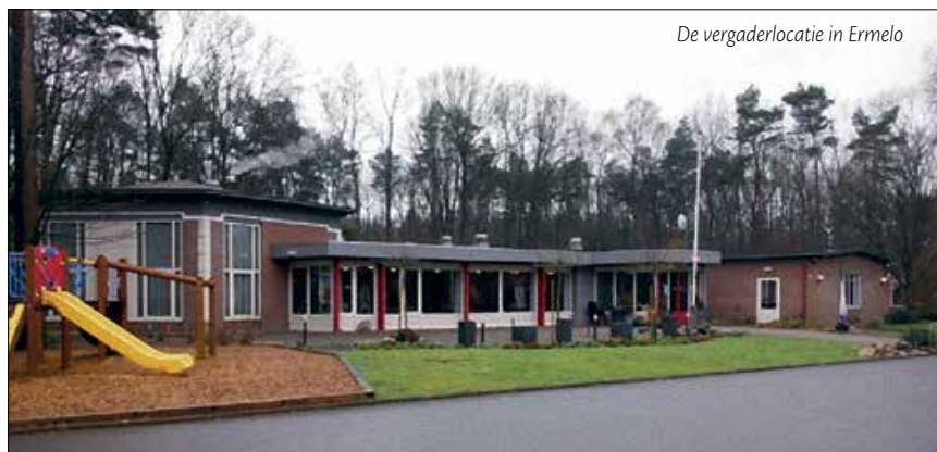
De vergaderlocatie in Ermelo

Neem afslag 12 richting Ermelo N303, rijd 400m. Sla rechtsaf naar de Oranjelaan/N303, Ga verder op de N303, ga rechtdoor over 4 rotondes, rijd 3,4 km. Neem op de rotonde de 3e afslag naar Leuvenumseweg, rijd 1,3 km. Sla rechtsaf richting Leuvenumseweg, u vindt de locatie rechts.