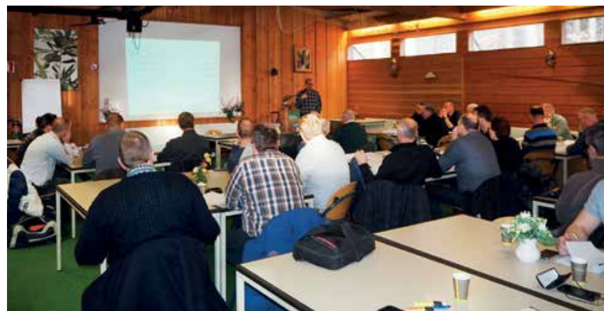
De cursus Wet natuurbescherming (voor politie en groene boa's)

We verkennen momenteel de mogelijkheid een cursus over Vistropierij te ontwikkelen, naast de cursussen Wet natuurbescherming, Roofvogelvervolging en Stroperij. Tevens zijn er verkennende gesprekken met een ROC hoe wij daar als academie een bijdrage kunnen leveren in het boa-onderwijs, niveau 3 en 4, domein 1. Met Staatsbosbeheer zijn er gesprekken of wij iets kunnen betekenen in hun proces van overgang van louter gastheer zijn in hun domein naar meer een gastheer die ook handhavend kan en moet optreden. Verder werken we aan een cursus Herkenning vervolg wilde fauna (stroperij), speciaal voor opsporingsambtenaren. Deze cursus is vergelijkbaar met de cursus voor IVN-ers e.d., maar dan gaan we meer de diepte in, gericht op handhaving.