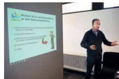
Punt van zorg is het kleine aantal beschikbare docenten

We verkennen momenteel de mogelijkheid een cursus over Vistropierij te ontwikkelen, naast de cursussen Wet natuurbescherming, Roofvogelvervolging en Stroperij. Tevens zijn er verkennende gesprekken met een ROC hoe wij daar als academie een bijdrage kunnen leveren in het boa-onderwijs, niveau 3 en 4, domein 1. Met Staatsbosbeheer zijn er gesprekken of wij iets kunnen betekenen in hun proces van overgang van louter gastheer zijn in hun domein naar meer een gastheer die ook handhavend kan en moet optreden. Verder werken we aan een cursus Herkenning vervolg wilde fauna (stroperij), speciaal voor opsporingsambtenaren. Deze cursus is vergelijkbaar met de cursus voor IVN-ers e.d., maar dan gaan we meer de diepte in, gericht op handhaving.