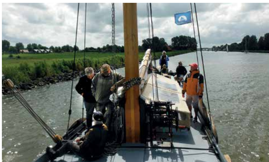
De onderlinge samenwerking verbeteren: redactie en academie aan boord van de Sneeker Skûtsje

In 2017 is er een server bij de redactie geïnstalleerd. Wij gaan vanaf 2018 alle bestanden en foto's middels een "cloud" omgeven op die server uitwisselen.