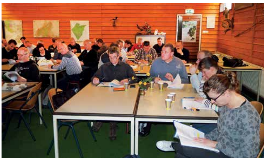
De inzet was groot en de cursisten waren zeer tevreden over de geboden stof

Er zijn nog wel wat organisatorische zaken op te lossen, maar daar is al een begin mee gemaakt en dat wordt in 2018 verder afgerond. Het Boa-event van de Sdu, de cursus 'Nieuwe Wet natuurbescherming' is gegeven en ook was er een presentatie over XTC-afval in samenwerking met het NFI. Beide workshops werden goed ontvangen. In het blad van maart 2018 is hiervan verslag gedaan.