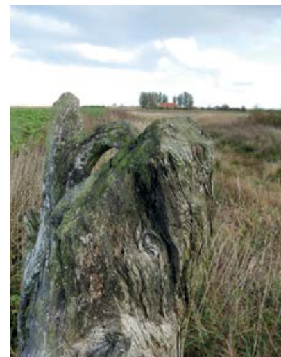
Het Stobbenveen zelf is het oudst bekende fossiele bos van Nederland en het vierde aardkundig monument

Zeven hoge sprietten in het landschap markeren de plek waar eeuwenoude boomstobben zijn gevonden. Tijdens de herinrichting van De Onlanden kwamen spectaculaire hoeveelheden stammen en stronken uit het veen te voorschijn. Een deel van de stobben is opgeruimd, maar de vondst leidde wel tot een onderzoek van de Rijksdienst voor het Cultureel Erfgoed. Het bleek dat de stobben voornamelijk bestaan uit dennen en een enkele berk en eik, in ouderdom variërend van 7.000 tot 10.000 jaar. Eén van de aangetroffen eiken is 7.800 jaar oud en is daarmee de oudst bekende eik uit Nederland. Het Stobbenveen zelf is het oudst bekende fossiele bos van Nederland en het vierde aardkundig monument. Ik neem afscheid van beide heren en rij natuurlijk nog even naar het stobbenmonument. Geen spijt van, want het is prachtig. Op het informatiebord lees ik dat het in 2014 is onthuld. Als ik dichterbij kom zie ik dat de sprietten zijn getooid met glanzende goudkleurige eikenbladeren, die fraai afsteken tegen de blauwe lucht. Een indrukwekkend kunstwerk, gemaakt door een lokale kunstenaar, Evert van Fucht. Het is een mooie afsluiting van een bijzondere dag daar in het hoge noorden op de grens van