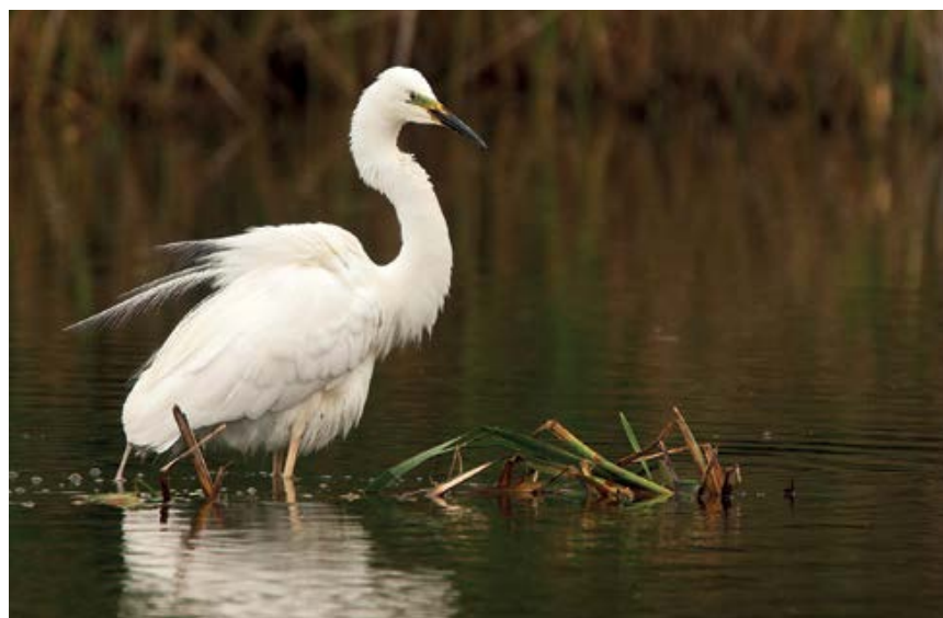
Grote Zilverreiger