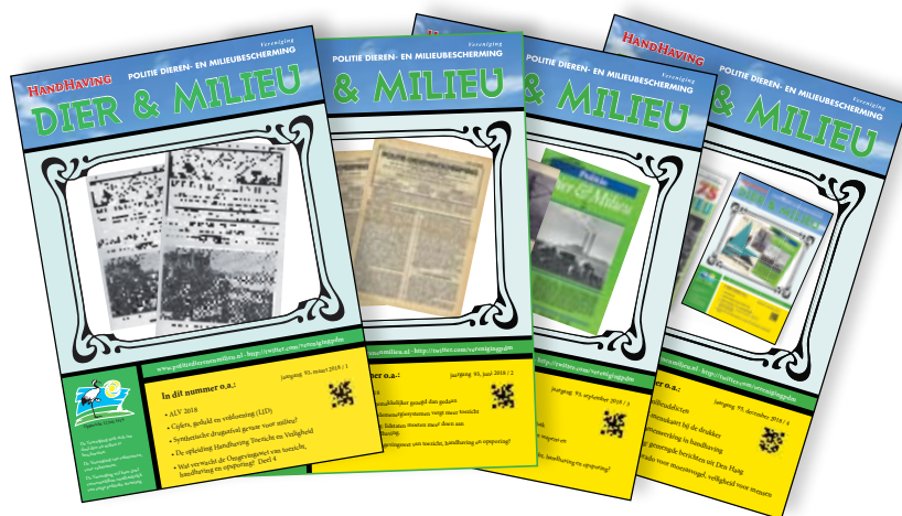
Onze leden hebben ook in 2018 weer 4 nummers van Dier & Milieu ontvangen

Daarnaast zijn wij niet dagelijks onderweg en hebben we dus geen actueel nieuws te melden. Wij hebben wel afgesproken dat we de site gaan aanpassen om de toegankelijkheid van informatie, gerelateerd naar vaste items in Dier & Milieu, mogelijk te maken. Deze aanpassing zal begin 2019 worden doorgevoerd.