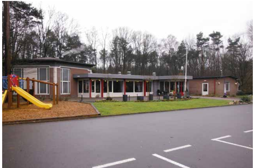
ECHOS Home „De Schakel” aan de Leuvenumseweg 68, 3852 AS te ERMELO.

Naar verwachting zal de vergadering tot 12.30 uur duren, waarna er een lunch wordt aangeboden.