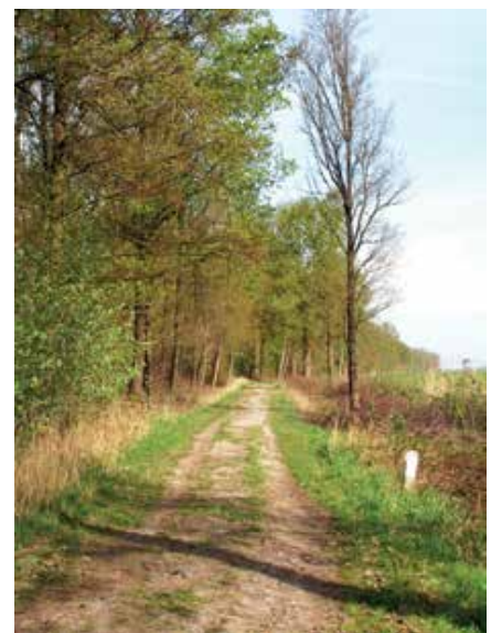
Dier & Milieu 2019 - Pagina 37

Probeer hem maar eens te vinden: een kwijgeraakte klem zorgde voor veel consternatie