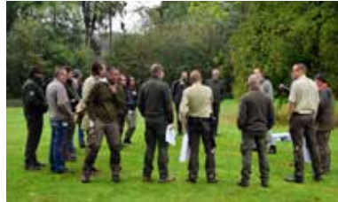
Workshop tijdens de boa dagen

We zullen goed aan de weg moeten timmeren om onze cursussen te verkopen. Daarvoor zijn de docenten op dit moment al weer hard aan het werk.