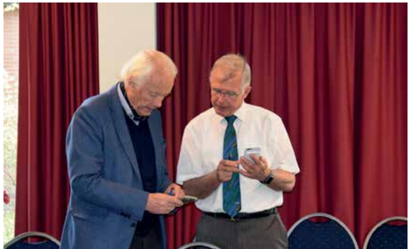
Een bedrag van € 100,- aan, bestemd voor de aanschaf van een luchtfoto van de Markerwaarden, met een "tikkie" is het zo geregeld

Omdat het bestuur van mening is dat honderd jaar PDM toch een 'kroon op ons werk' is, hebben we besloten het logo van de vereniging met een kroon op de kop van de kraanvogel aan te passen.