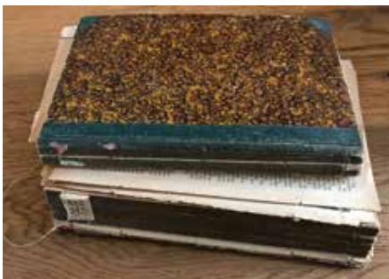
Het oude fysieke archief begon te lijden onder de soms hoge leeftijd