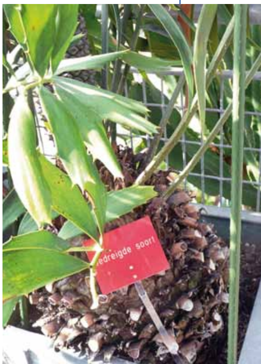
" Ceratozamia mexicana Brongn." behorende tot de Cycadales - Zamiaceae.

Esselman verwacht dat de nieuwe werkwijze voor de inspecteur in het veld zeer motiverend zal zijn: hij of zij kan zelf een dossier raadplegen en krijgt daarmee een instrument in handen om veel actiever op te treden. De controleur wordt serieus genomen! Hij kan ook zien wat er gebeurt met een door hem aangebrachte zaak – gaat het OM al dan niet vervolgen, hoe luidt het vonnis, welke sancties worden opgelegd - en daar vervolgens weer van leren.