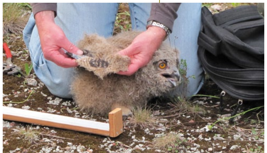
De vleugellengte wordt opgemeten.