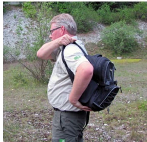
Belangstelling voor het onderzoek.

Tekst en foto's: Wil Kroon en Koos Kasemir