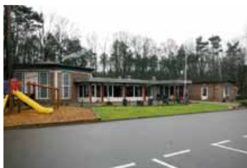
Nieuwe vergaderlocatie: ECHOS Home „De Schakel” aan de Leuvenumseweg 68, 3852 AS te ERMELO

Neem afslag 12 richting Ermelo richting N303, rijd 400m Sla rechtsaf naar de Oranjelaan/N303, Ga verder op de N303, ga rechtdoor over 4 rotondes, rijd 3,4 km Neem op de rotonde de 3e afslag naar Leuvenumseweg, rijd 1,3 km Sla rechtsaf richting Leuvenumseweg, u vindt de locatie rechts.