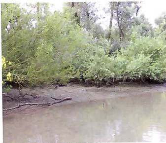
Stap je hier uit, dan verdwijnt je meteen tot aan je kruis in de blubber.

Naast vogel- en natuurkenner, vaardig schipper, groot Biesboschspecialist en deskundige gids blijkt Van der Neut ook een onderhoudende en interessante gesprekspartner te zijn.