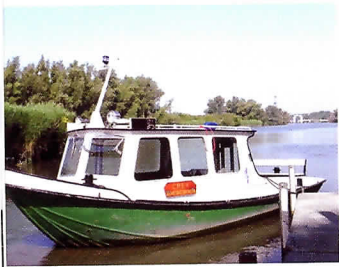
Bij aankomst staat de koffie klaar aan boord van de 'Crex'.

Onze tocht gaat verder via de Kikvors of Otter en we minderen even vaart bij een beverburcht. Goed versholen tussen de dichte begroeiing ontwaren we een enorme takkenhoop. Sinds hier in 1988 bevers uitgezet zijn, nemen hun aantallen nog steeds toe. "De eerste bevers in de Biesbosch dat was me wat," herinnert Van der Neut zich. "Man, de dieren werden gezenderd en elke scheet die ze lieten werd bij wijze van spreken geregistreerd. Nu zijn ze volledig geïntegreerd en tellen we maar liefst 300 tot 350 dieren, verdeeld over 90 burchten. Fantastisch."