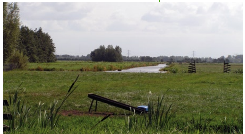
Is iemand eigenaar (of erfpachter, pachter, vruchtgebruiker of bekleemde meier) van een perceel weiland dan is diegene ook de jachthouder op dat perceel weiland.