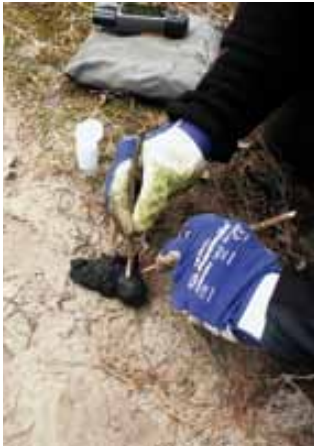
Onderzoek van een wolvendrol in voormalig militair oefenterrein Świątoszów in Zuidwest-Polen.

3 De Nijmeegse Stichting Taurus levert inmiddels vrij ingeburgerde soorten grazers aan Natuurmonumenten, Staatsbosbeheer en Brabantse gemeenten, maar houdt zich bovendien bezig met het ontwikkelen van 'een volwaardige vervanger voor het uitgestorven oerrund': de 'Taurus' of TaurOs.