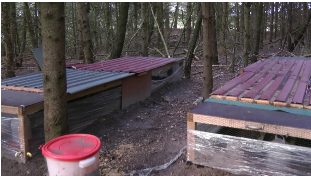
Abb.5: Gehege mit weiteren Fasanen (Jungvögel)