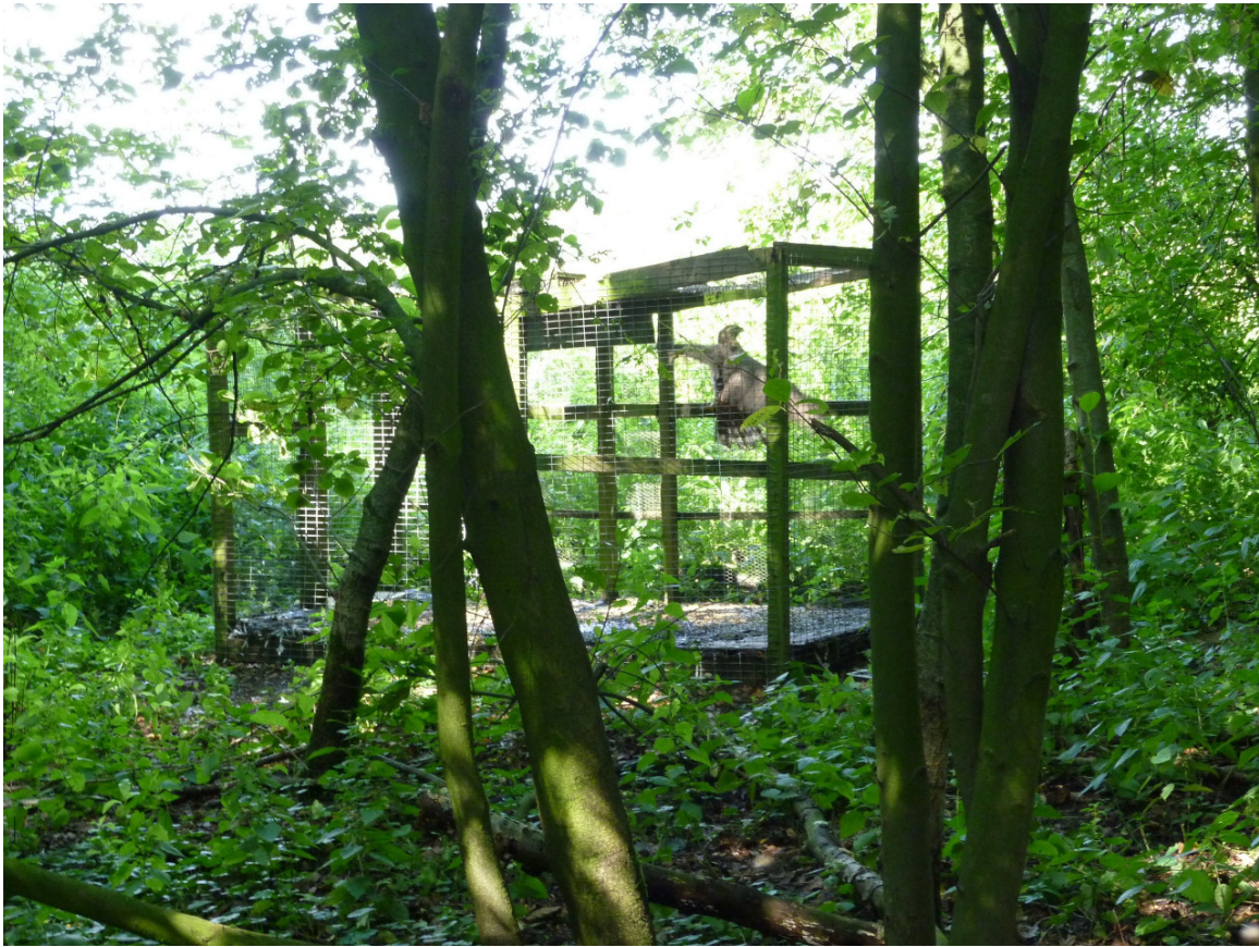
Abb.7: Gefangener Habicht in Leiterfalle 1 (aufgenommen am 18.8.2011)