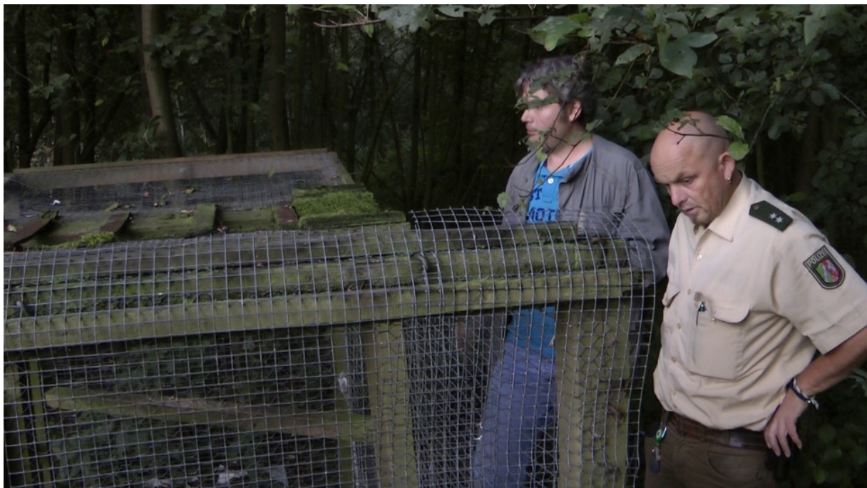
Abb.9: Besichtigung von Leiterfalle 1 durch die Polizei am 18.08.2011