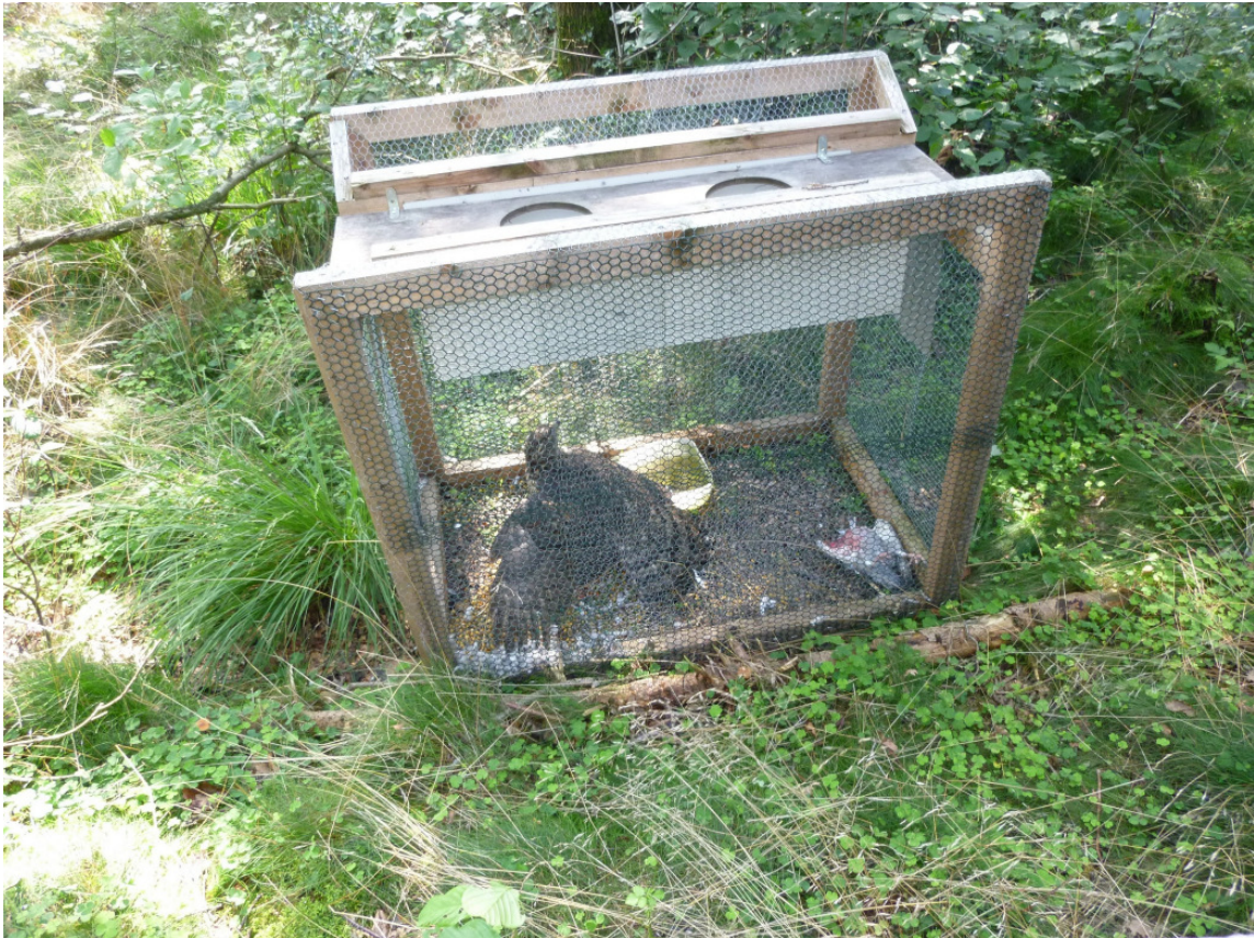
Abb.6: Gefangener Habicht in Leiterfalle 3 (aufgenommen am 18.8.2011)