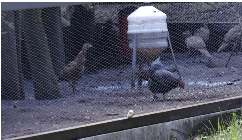
Abb.3 und 4: Innenansicht der Fasanerie