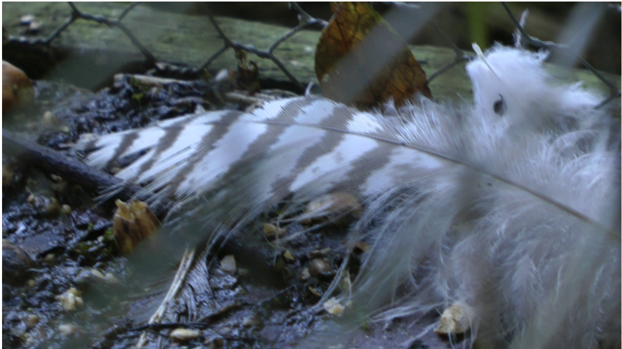
Abb.8: Feder eines frisch gefangenen Habichtes in Leiterfalle (aufgenommen am 15.08.2011)