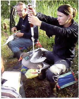
De ganzen worden gewogen.