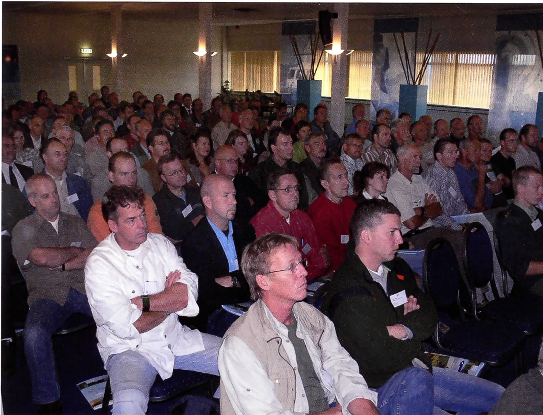
Hoe bereikt PDM de doelgroep het best.