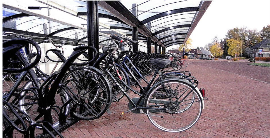
Fietsendiefstal levert bijvoorbeeld 10 punten op.

Het op die manier berekende aantal strafpunten wordt vervolgens omgezet in sanctiepunten, die de basis vormen voor de strafeis. Een sanctiepunt staat voor € 29,- aan transactie, strafbeschikking of boete, voor één dag gevangenisstraf of twee uur taakstraf. Tot 180 strafpunten staat ieder strafpunt gelijk aan een sanctiepunt, daarboven vindt afvlakking plaats. Er bestaat al jaren een algemene Richtlijn voor strafvordering regelgeving Ministerie van LNV , waarin strafpunten zijn opgenomen voor overtreding van o.a. het Kalverenbesluit, het Varkensbesluit, het Besluit welzijn productiedieren en Verordening (EG) 1/2005. Voorbeelden van overtredingen zijn het permanent of geregeld aanbinden van een rund (standaard 9 punten plus 1 punt per dier) en het niet verwijderen