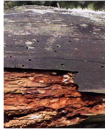
Allerlei insecten zetten op grote schaal hun eitjes af in de verbrande boomstammen.