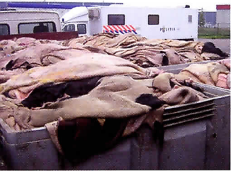
De huiden waren niet afgedekt.