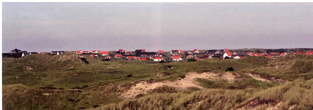
Inpassen in het Landschap.