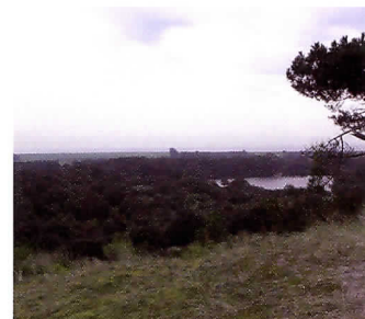
Van duinen richting Waddenzee.