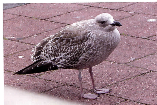
Vaste bezoeker van West Terschelling.

Alleen over de Waddenzee kan al een heel blad van PDM gevuld worden. Voorlopig beperk ik mij in dit stuk maar tot de natuur op Terschelling. Later misschien iets meer over die fascinerende Wadden!