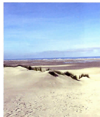
Brede stranden op Terschelling.