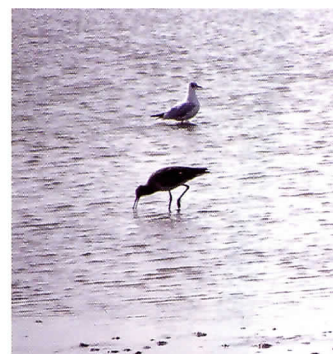
Voor vogels is het een waar voedselparadijs.