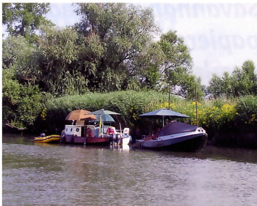
Verschillende met name genoemde wateren, de wateren in de Dordtsche en Brabantse Biesbosch